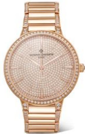
VACHERON CONSTANTIN Patrimony 36.5mm small 18-karat rose gold diamond watch $93,000