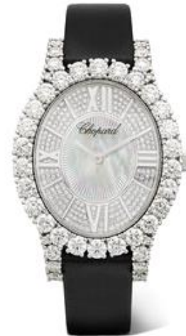
CHOPARD L'Heure du Diamant 34.10mm 18-karat white gold, satin, diamond and mother-of-pearl watch $83,100