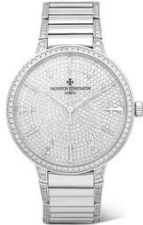
VACHERON CONSTANTIN Patrimony 36.5mm small 18-karat white gold diamond watch $93,000