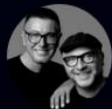
Domenico Dolce and Stefano Gabbana Dolce & Gabbana