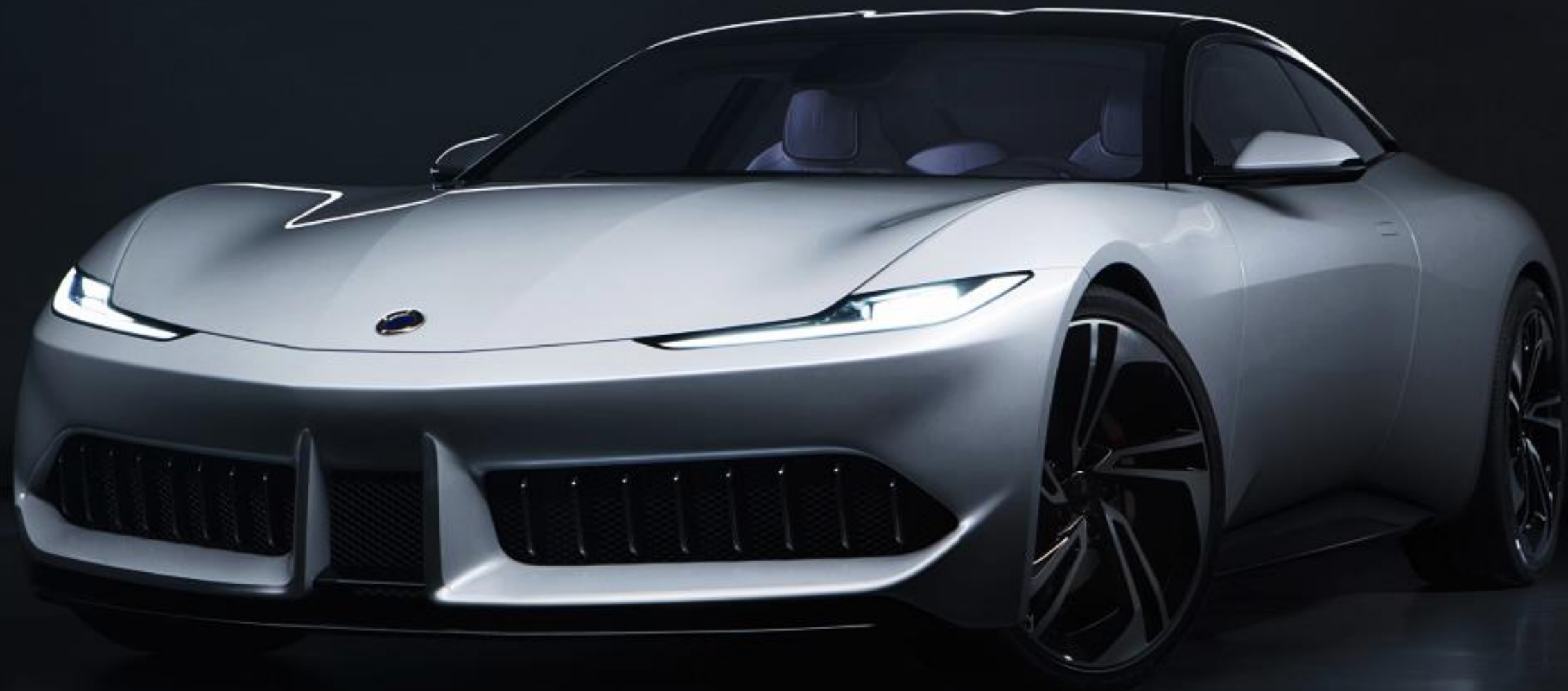
Karma Pininfarina GT