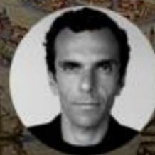
Cédric Charbit Balenciaga